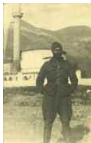
1592 ΕΛΥΤΗΣ ΟΔΥΣΣΕΑΣ 17 φωτογραφίες Τύπου του ποιητή από εκδηλώσεις, η μία από το μέτωπο της Αλβανίας, το 1941. Διαστάσεις 10,5 χ 7,5 εκ. έως 20 χ 25,5 εκ. 150-200