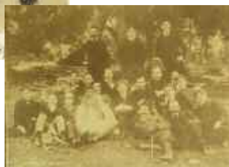
1593 ΚΑΖΑΝΤΖΑΚΗΣ Ν. ΤΑΞΙΔΙ ΣΤΗΝ ΚΙΝΑ. 4 φωτογραφίες από το ταξίδι του το 1957. Μαζί στις φωτογραφίες η Ελένη Καζαντζάκη και η Νέλλη Ευελπίδη. Διαστάσεις 20,5 χ 15 εκ. Και 19,5 χ 20 εκ. 80-100