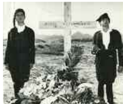
1591 ΚΑΖΑΝΤΖΑΚΗΣ Ν. ΚΗΔΕΙΑ ΚΑΙ ΜΝΗΜΟΣΥΝΟ. Ηράκλειο Κρήτης, 1957 και 1960. 13 φωτογραφίες από την κηδεία και 13 από το μνημόσυνο. Διαστάσεις 10 χ 6,5 εκ. έως 24 χ 18 εκ. 120-150