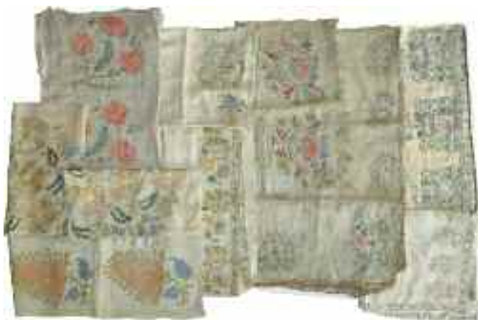
2191 ΤΣΕΒΡΕΔΕΣ Δέκα κεντήματα της Μικράς Ασίας και της Ανατολικής Θράκης με διάφορα σχέδια σε διάφορα μεγέθη. (10) 350-500