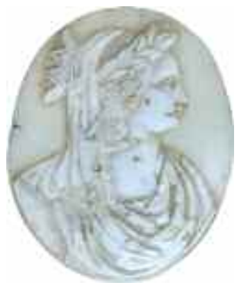
2212 ΚΑΜΕΟ Γυναικεία μορφή. Διαστάσεις 4 χ 5 εκ. 60-80