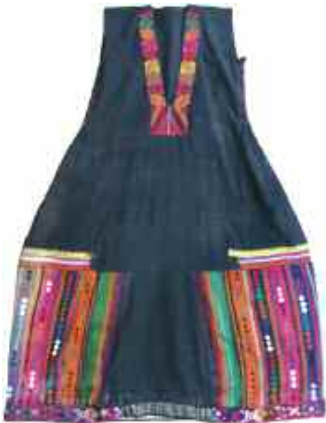
2188 ΒΑΛΚΑΝΙΑ Αμάνικο μαύρο φουστάνι με πολύχρωμα κεντήματα στον ποδόγυρο και στην τραχηλιά. Ύψος 113 εκ. 50-60