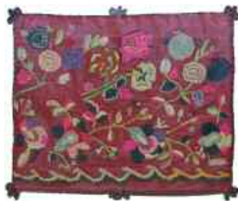
2194 ΜΑΞΙΛΑΡΟΘΗΚΗ Με κεντητό φυτικό διάκοσμο. Διαστάσεις 53 χ 65 εκ. Σε κορνίζα. 50-60