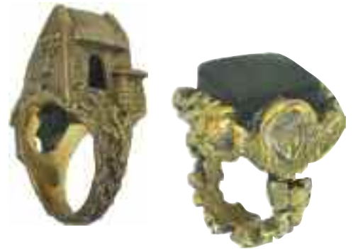
2227 ΔΑΧΤΥΛΙΔΙΑ Δύο χάλκινα δαχτυλίδια με έντονο ανάγλυφο διάκοσμο μαζί. Το ένα με μαύρη τετράγωνη πέτρα. Μήκος 3 εκ και 3,5 εκ. (2) 90-100