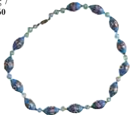
2226 ΒΕΝΕΤΣΙΑΝΙΚΟ ΚΟΛΙΕ Με γυάλινες χάντρες με επίθετα διακοσμητικά στοιχεία. Μήκος 51 εκ. 40-50