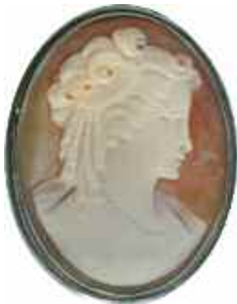
2209 ΚΑΜΕΟ Με ανάγλυφο γυναικείο πορταίτο. Διαστάσεις 3,2 χ 2,5 εκ. 40-50