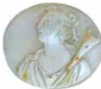
2215 ΚΑΜΕΟ Νέος με μουσικό όργανο. Διαστάσεις 4,5 χ 4 εκ. 60-80