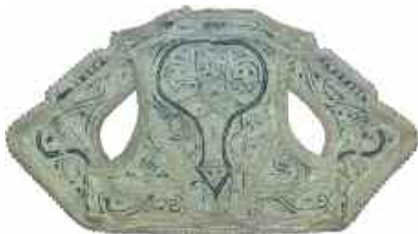
2190 Γιλέκο, ηπειρώτικο. Διαστάσεις 33 χ 58 εκ. Σε κορνίζα. 120-150