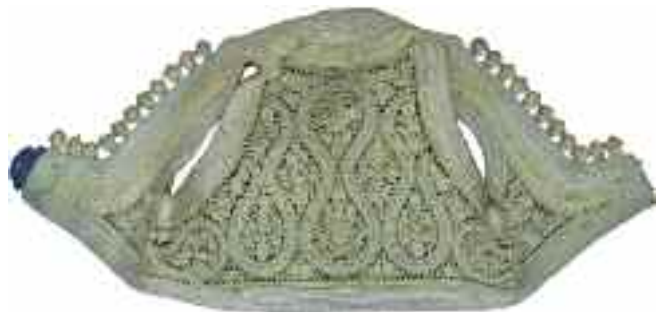
2189 ΗΠΕΙΡΟΣ ΓΙΛΕΚΟ χρυσοκέντητο. Ύψος 32 εκ. 100-120