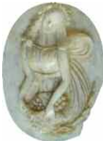
2214 ΚΑΜΕΟ Σπάσιμο της πέτρας κάτω δεξιά. Διαστάσεις 3,5 χ 4,5 εκ. 60-80