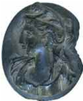
2217 ΚΑΜΕΟ Γυναικεία μορφή. Με σπάσιμο της πέτρας στη δεξιά πλευρά. Διαστάσεις 3,5 χ 4 εκ. 60-80