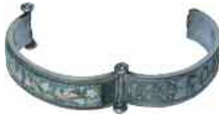
2222 ΒΡΑΧΙΟΛΙ CASTELLIANI Μεταλλικό με σμάλτινο ανάγλυφο, φυτικό και πτηνόμορφο διάκοσμο και ανάγλυφη επιγραφή "ROMA" στην μία όψη. ca 1850. Μήκος 7 εκ. 240-260