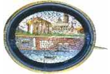
2223 ΚΑΡΦΙΤΣΑ ROMA TEMPO D' VIESTA Με μικροψηφιδωτό. Διαστάσεις 4,5 χ 3,5 χ 1 εκ. 70-80