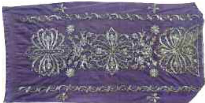
2193 Θρακιώτικο. Χρυσοκέντητο. Διαστάσεις 48 χ 93 εκ. Σε κορνίζα. 120-150