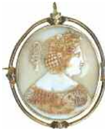
2211 ΚΑΜΕΟ ΚΑΡΦΙΤΣΑ. Δεμένο με μέταλλο. Διαστάσεις 6 χ 7 εκ. 250-280