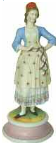
2228 Ζευγάρι ελλήνων με παραδοσιακές φορεσιές από γαλλική πορσελάνη. Ύψος 30 εκ. π.1870 Μικρό πρόβλημα στα δάκτυλα του δεξιού χεριού της γυναικίας φιγούρας.