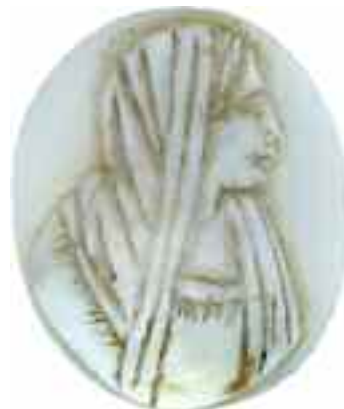
2219 ΚΑΜΕΟ Γυναικεία μορφή. Διαστάσεις 3 χ 3,5 εκ. 60-80