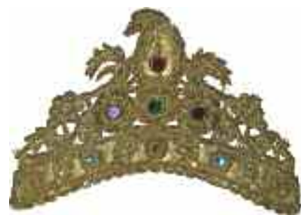
2196 ΚΑΛΥΜΜΑ ΚΕΦΑΛΗΣ ΚΕΝΤΗΤΟ σε θήκη πλέξιγκλας. Διαστάσεις 16 χ 24 εκ. 180-200