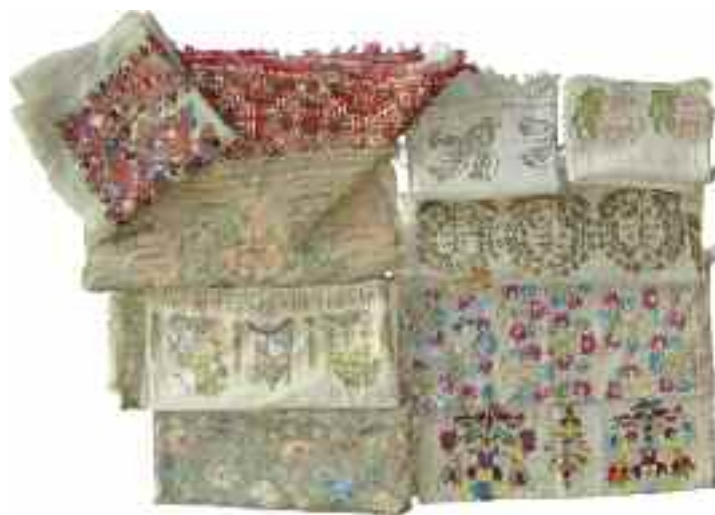
2192 ΤΣΕΒΡΕΔΕΣ Δέκα κεντήματα της Μικράς Ασίας και της Ανατολικής Θράκης με διάφορα σχέδια σε διάφορα μεγέθη. (10) 350-500