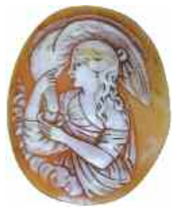
2220 ΚΑΜΕΟ Διαστάσεις 3 χ 3,5 εκ. 60-80