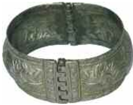
2221 ΒΡΑΧΙΟΛΙ Ασήμι με ανάγλυφο φυτικό διάκοσμο. Διαστάσεις 6,5 χ 5,5 χ 3 εκ. 25-30