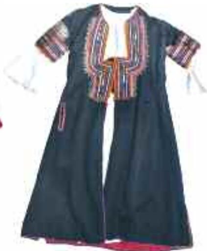
2186 ΒΑΛΚΑΝΙΑ Φουστάνι λευκό με λεπτή δαντέλα στο τελείωμα του ποδόγυρου και στα μανίκια. Ύψος 95εκ Επενδυτής με πολύχρωμα κεντήματα στην τραχηλιά και στα μανίκια και τσέπη λοξή στην δεξιά πλευρά. Ύψος 100 εκ. (2) 50-60