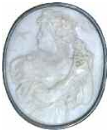
2213 ΚΑΜΕΟ ΠΟΡΠΗ. Δεμένο με μέταλλο. Διαστάσεις 5,5 χ 6 εκ. 200-250