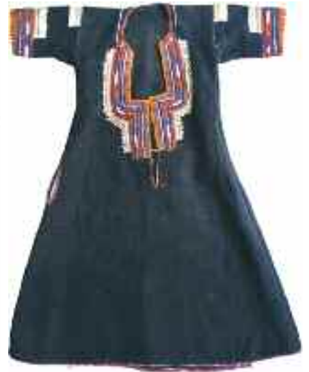
2187 ΒΑΛΚΑΝΙΑ Μαυρο φουστάνι με μανίκια. Πολύχρωμα κεντήματα στην τραχηλιά και στα μανίκια. Τσέπη λοξή στην δεξιά πλευρά. Ύψος 105 εκ. 50-60