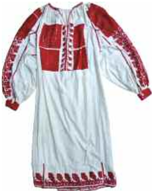
2185 ΒΑΛΚΑΝΙΑ Φουστάνι λευκό με μακρυά μανίκια, κεντημένο με κόκκινη κλωστή στο στήθος, στον ποδόγυρο και στα μανίκια. Ύψος 115 εκ. 50-60