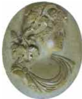
2210 ΚΑΜΕΟ Νέος. Διαστάσεις 3 χ 3,5 εκ. 60-80