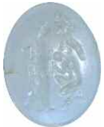
2216 ΚΑΜΕΟ Έγγλυφο. Διαστάσεις 3 χ 4 εκ. 60-80