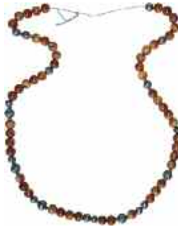
2225 ΚΟΛΙΕ Με γυάλινες και μεταλλικές χάντρες με ανάγλυφα στοιχεία. Μήκος 104 εκ. 80-90