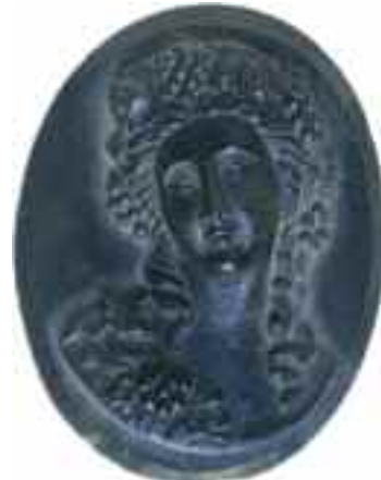
2218 ΚΑΜΕΟ Γυναικεία μορφή. Διαστάσεις 3,5 χ 4 εκ. 60-80