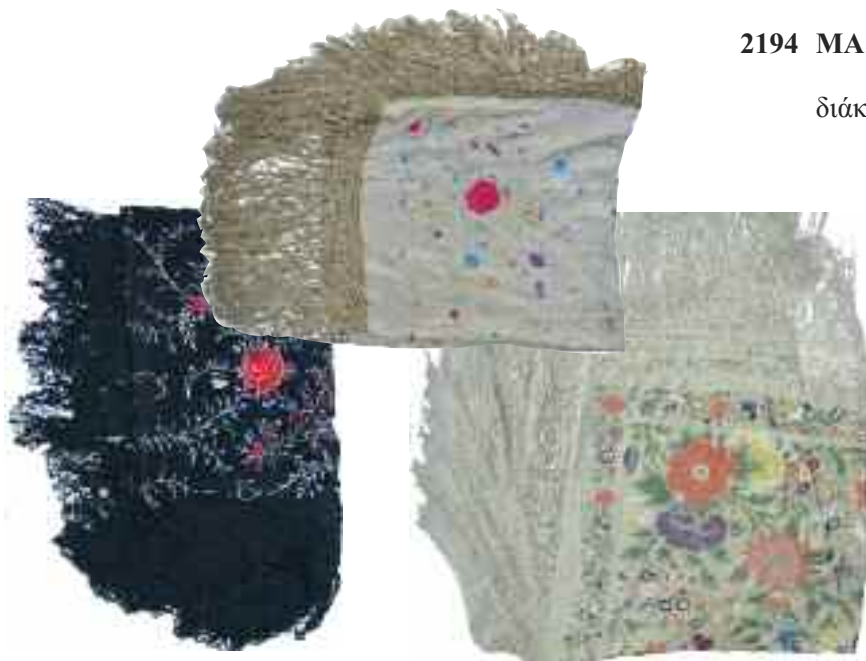
2195 ΚΕΝΤΗΜΑΤΑ Τρία τραπεζομάντηλα μαζί. Ένα μαύρο και δύο ανοιχτόχρωμα με κεντητό φυτικό διάκοσμο και κρόσια. Διαστάσεις 170 χ 140 εκ. το κάθε ένα περίπου. (3) 200-250