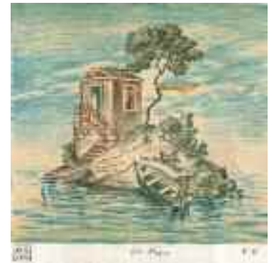
2165 ΑΓΓΕΛΙΔΗΣ ΝΙΚΟΣ (γεν. 1957) 2 λιθογραφίες με αφιέρωση "Στο Μάριο..." . Με υπογραφή κάτω αριστερά και "Ε.Α." κάτω δεξιά. Διαστάσεις 20 χ 19 εκ. Έκαστη. 30-40