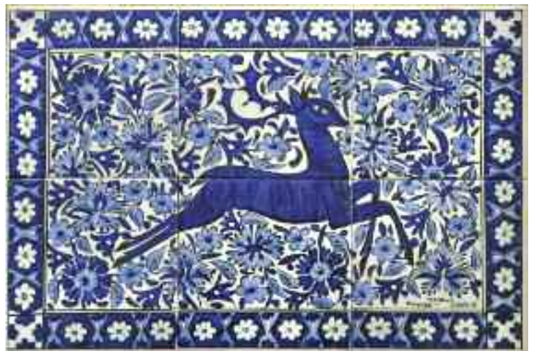
1900 ΙΚΑΡΟΣ Ελάφι. Σύνθεση από έξι υαλωμένα πλακάκια με ελάφι και φυτικό διάκοσμο. Στο κάτω μέρος του καθενός "Hand Made in Rhodes-Greece by Ikaros Pottery". Διαστάσεις 15 χ 15 εκ. έκαστο. Σύνθεση 30 χ 45 εκ. Μικρό πρόβλημα σε ένα πλακάκι.