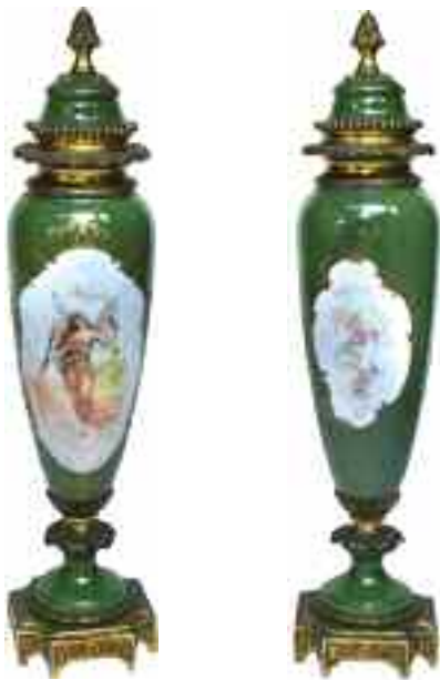
1888 ΓΑΛΛΙΚΟ ΒΑΖΟ 19ου αι. Από πορσελάνη και μπρούντζο. Με επιζωγραφισμένο φυτικό διάκοσμο και νεράιδας. Το καπάκι καταλήγει σε λαβή από βελανίδι. Ύψος 55 εκ. 180-250