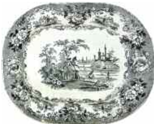
2235 Κεραμική πιατέλα με φιλελληνικό θέμα σφραγίδα "Warrantee Staffordshire, Stone China J.T.H. - Greek Statue". Διαστάσεις 27,5 χ 34 εκ. 90-110