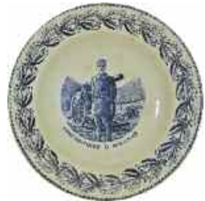
2234 ΚΩΝΣΤΑΝΤΙΝΟΣ Ο ΝΙΚΗΤΗΣ. Πιάτο ρηχό από φαγεντιανή με εικόνα του Κωνσταντίνου Α' με φυτικό διάκοσμο στην μπροσούρα και εμπίεστο γράμμα "J" στο κάτω μέρος. Διάμετρος 23 εκ. 200-220