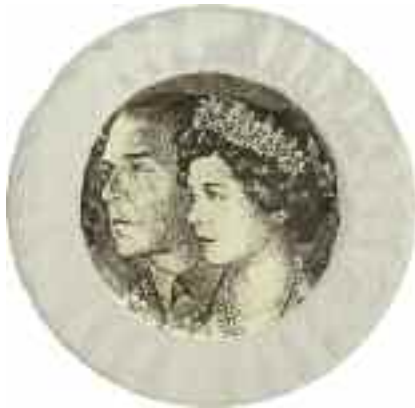
2232 ΚΕΡΑΜΕΙΚΟΣ ΠΑΥΛΟΣ Α' & ΦΡΕΙΔΕΡΙΚΗ. Κεραμικό μικρό, ρηχό πιάτο με δαντελωτή μπροσούρα. Σφραγίδα κατασκευαστή στην κάτω όψη. Διάμετρος 21 εκ. 40-50