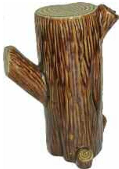
1898 ΙΚΑΡΟΣ ΚΟΡΙΜΟΣ. Κεραμικός, υαλωμένος με κλαδόμορφη ροή βουλωμένη με φελλό και κερί που φέρει σφραγίδα "Triadafillou" και με σφραγίδα "Ποτοποιία Ν.Α. Τριανταφύλλου, Ικαρος Ρόδος" στο κάτω μέρος. Ύψος 22,5 εκ.