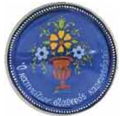
1904 'Ο καπνίζων σταθερώς καρκυνοβατεί. Γυάλινο τασάκι μπλέ χρώματος. Με φυτικό διάκοσμο και υπογραφή "Μποστ". Διάμετρος 13 εκ 50-60