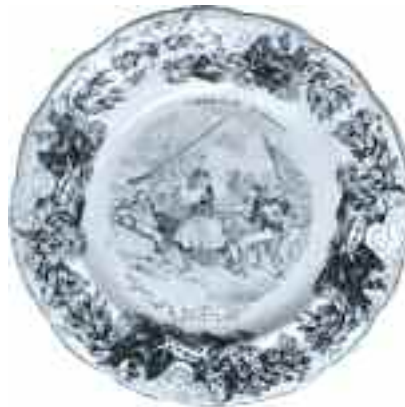
2233 Expedition d'Orient. Defaite des Insurges Grecs au Camp de Peta (Epire) N 29. Πιάτο από φαγεντιανή με δαντελωτή μπροσούρα και φιλελληνικό θέμα. Σφραγίδα κατασκευαστή "Geoffroy et C." στην κάτω όψη. Διάμετρος 20 εκ. 80-100