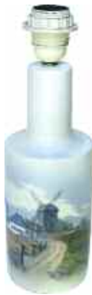
1887 COPENHAGEN ΒΑΣΗ ΛΑΜΠΙΑΣ από πορσελάνη με επιζωγραφισμένη άποψη χωριατόσπιτου με μύλο. Με σφραγίδα κατασκευαστή "Royal Copenhagen Denmark 206 4622" στην κάτω όψη. Ύψος 33 εκ. 200-250