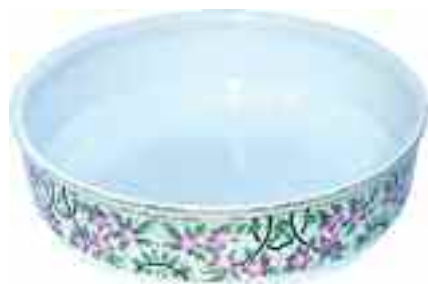
1855 ΝΙΜΥ ΓΑΒΑΘΑ κεραμική με φυτικό διάκοσμο. Με σφραγίδα κατασκευαστή "Manufacture Imperiale Royale NIMY Fabrication Belege Made in Belgium" στο κάτω μέρος. Διάμετρος 36,5 εκ. Ύψος 12 εκ. 40-50