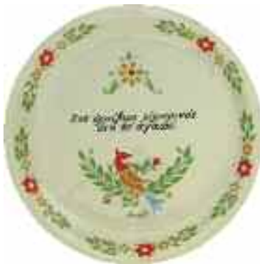
1903 ΜΠΟΣΤ Κεραμικό πιάτο με επιγραφή "Σου ορκίζομε ειλικρινός ότη σε αγαπό". Σφραγίδα κατασκευαστή "Ionia Greece 4.10" στην κάτω όψη. Διάμετρος 24 εκ. 20-25