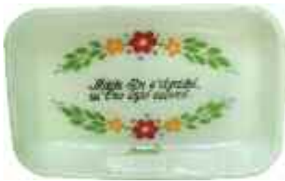
1902 ΜΠΟΣΤ ΠΙΑΤΟ ΚΕΡΜΑΤΩΝ γυάλινο με επιγραφή "Μάθε ότι σ'αγαπό κι'εχω ιερό σκοπό." με ανάγλυφη υπογραφή κατασκευαστή "Olympic Airways" στο κάτω μέρος. Διαστάσεις 11 χ 16,5 χ 3,2 εκ. 25-30