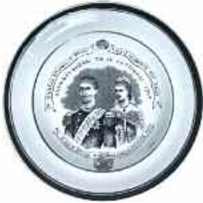
2229 ΓΕΩΡΓΙΟΣ Α' - ΟΛΓΑ ΕΝΥΜΦΕΥΘΗΣΑΝ ΤΗ 15 ΟΚΤΩΒΡΙΟΥ 1867. Βαθύ πιάτο μικρού μεγέθους από φαγεντιανή. Με μαύρους ομόκεντρους κύκλους στο χειλός. Διάμετρος 18 εκ. Αβιβλιογράφητο κατά Νταϊφά. 300-350