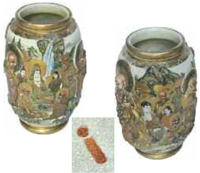
1886 ΒΟΥΔΑΣ. Δύο κεραμικά βάζα κινέζικης κατασκευής, επιζωγραφισμένα και υαλωμένα με έντονα ανάγλυφα στοιχεία και σφραγίδα με το σύμβολο του κατασκευαστή "satsouma" στο κάτω μέρος. Ύψος 25 εκ. Έκαστο. Διάμετρος 15 εκ. 350-400