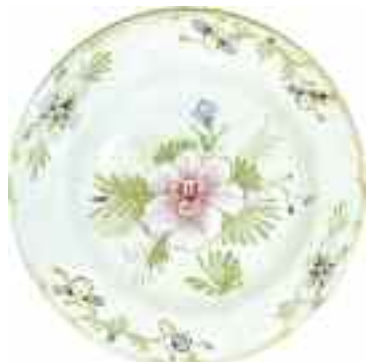
1849 ΤΕΤΣΗΣ ΠΑΝΑΓΙΩΤΗΣ Δύο κεραμικά, βαθιά πιάτα, επιζωγραφισμένα από τον ζωγράφο με υπογραφή και χρονολόγηση "Τέτσης 47" στο κάτω μέρος τους. Διάμετρος 23 εκ. έκαστο. (2) 150-200