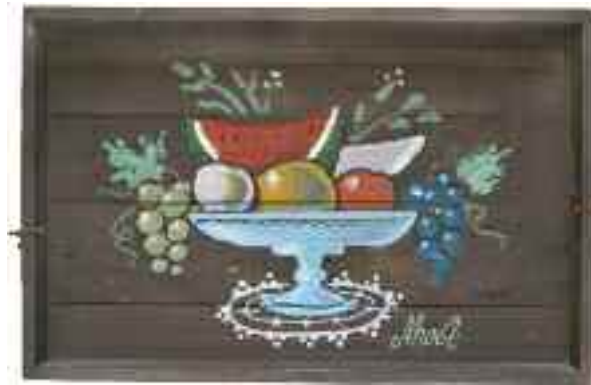
1901 ΜΠΟΣΤ Φρούτα σε σκεύος. Λάδι σε ξύλινο δίσκο σερβιρίσματος με χερούλια. Υπογραφή "Μποστ" κάτω δεξιά. Διαστάσεις 46 χ 30 χ 6,5 εκ. 500-600