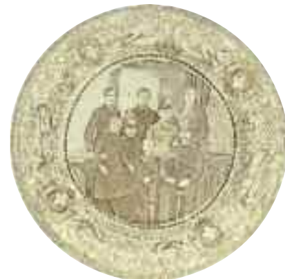
2236 ANDRONICOS & Co Η ΕΛΛΗΝΙΚΗ ΒΑΣΙΛΙΚΗ ΟΙΚΟΓΕΝΕΙΑ. Βαθύ πιάτο από φαγεντινή. Σφραγίδα κατασκευαστή "Andronicos & Ci, Birmingham" στο κάτω μέρος. Διάμετρος 24 εκ. 350-400