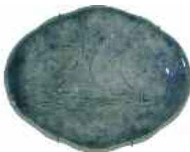
1851 ΚΕΡΑΜΕΙΚΟΣ, ΕΛΣΤΕΡΝ Μ.Μ. Δύο πιατάκια μαζί με ανάγλυφες εικόνες ιστιοφόρων. Σφραγίδες κατασκευαστή, καλλιτέχνη και χρονολόγηση "Κεραμεικός Αθήναι 1961 Μ.Μ. Έλστερν" στο κάτω μέρος. Διαστάσεις 12 χ 15 εκ. έκαστο. (2) 60-80