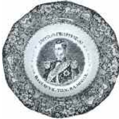
2230 ΓΕΩΡΓΙΟΣ Α' ΖΗΤΩ.Ο.ΓΕΩΡΓΙΟΣ.Α! ΒΑΣΙΛΕΥΣ.ΤΩΝ.ΕΛΛΗΝΩ Ν. Βαθύ πιάτο από φαγεντιανή, με κυματιστό χειλός. Διάμετρος 24 εκ. 250-300