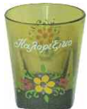
1907 ΠΟΤΗΡΙ γυάλινο με επιγραφή "Καλορίζομε". Ύψος 9,5 εκ. 20-25