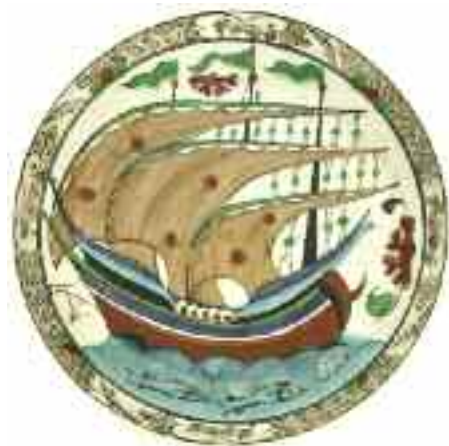
1850 ΙΚΑΡΟΣ Πιατέλα μεγάλη βαθιά, κεραμική επιζωγραφισμένο ναυτικό θέμα και σφραγίδα κατασκευαστή "Hand-Painted in Rhodes-Greece by Ikaros Pottery A/103" στην κάτω όψη. Διάμετρος 27 εκ. 40-50