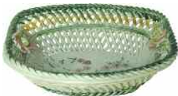
1854 ΚΕΡΑΜΕΙΚΟΣ ΠΙΑΤΕΛΑ κεραμική, υαλωμένη, με πλεκτά στελέχη και επίθετα στοιχεία. Διαστάσεις 20 χ 17 χ 7 εκ. 50-70