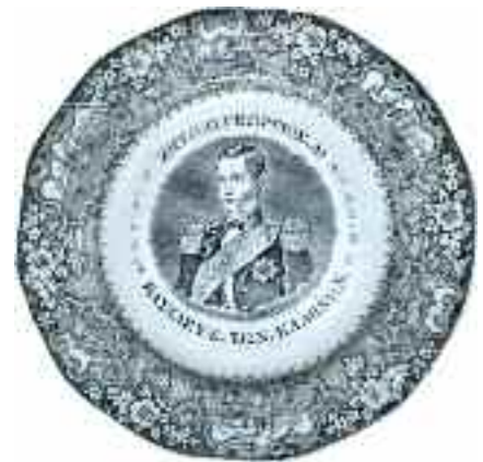
2231 ΓΕΩΡΓΙΟΣ Α' ΖΗΤΩ.Ο.ΓΕΩΡΓΙΟΣ.Α! ΒΑΣΙΛΕΥΣ.ΤΩΝ.ΕΛΛΗΝΩ Ν. Ρηχό πιάτο από φαγεντιανή, με κυματιστό χειλός. Διάμετρος 24 εκ. 250-300