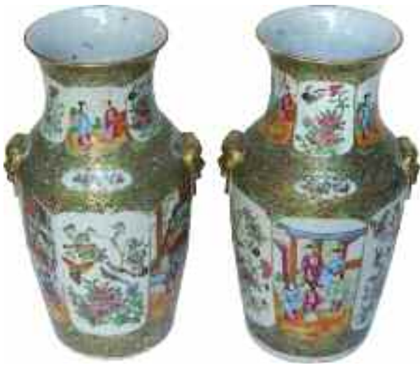
1885 ΚΙΝΕΖΙΚΑ ΒΑΖΑ από πορσελάνη με πλούσιο επιζωγραφισμένο και επισμαλτωμένο διάκοσμο. Στα πλαϊνά φέρουν κεφαλές λεόντων. Ύψος 35,5 εκ. έκαστο. (2) 350-400