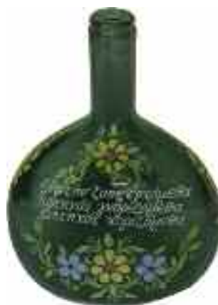
1906 ΜΠΟΥΚΑΛΙ - ΑΝΘΟΔΟΧΕΙΟ γυαλινό με επιγραφή "Εις την ζωήν ερχόμεθα εφτηχός γυνορίζομεθα Διστηχός χορίζομεθα". Ύψος 20 εκ. 25-30