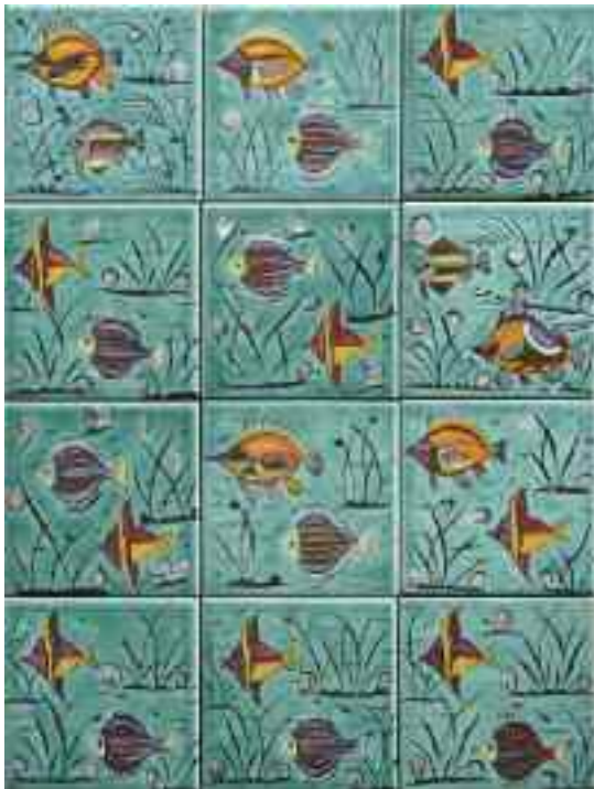
1899 ΙΚΑΡΟΣ Θαλασσινό θέμα. Σύνθεση από δώδεκα διαφορετικά υαλωμένα πλακάκια επιζωγραφισμένα με ψάρια και κοχύλια. Στο κάτω μέρος του καθενός "Hand Made in Rhodes-Greece by Ikaros Pottery". Διαστάσεις 11 χ 11 εκ. έκαστο. Σύνθεση 44 χ 33 εκ.